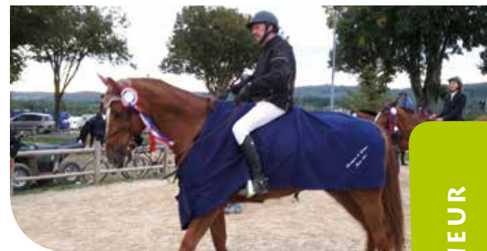
• Championnat de France à Cluny 2015

L'AJA est une association internationale (Association of Jumping Riding Ambassadors) qui regroupe en tout 300 membres (femmes de plus de 45 ans et hommes de plus de 50 ans) et dont l'activité