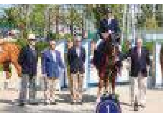
• Finale Barcelone 2015