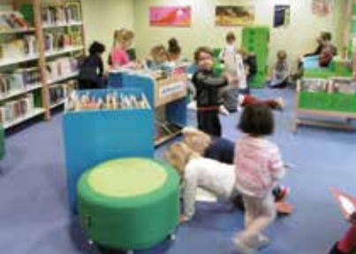
• La lecture, ça se partage