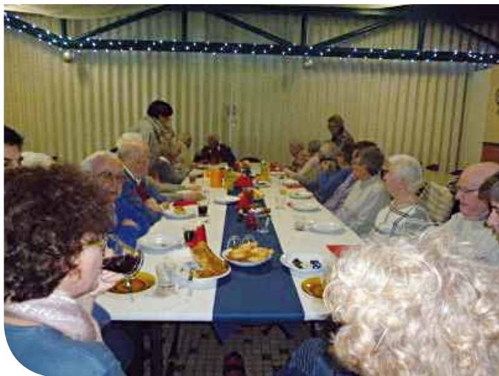
• Le goûter de Noël organisé par le SAAD