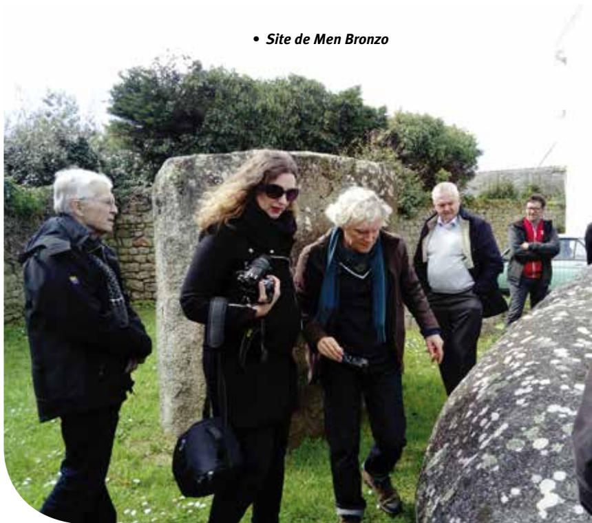
• Site de Men Bronzo