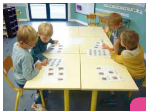
• Reconnaitre les prénoms