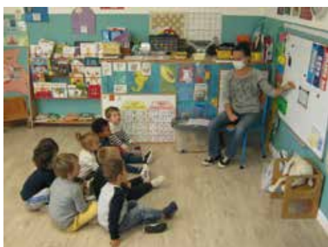
• Comprendre une histoire