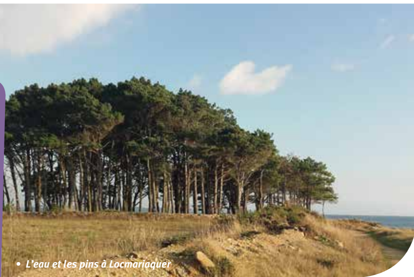
• L'eau et les pins à Locmariaquer