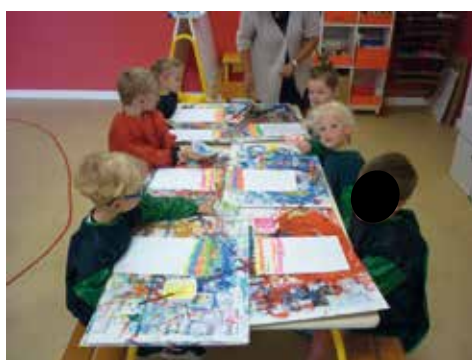
• Tracer des lignes horizontales