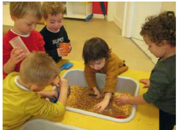
• Manipuler différentes matières