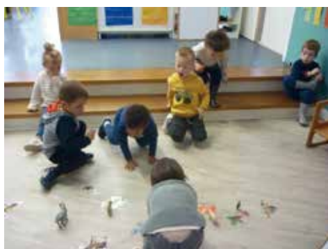
• Estimer des quantités