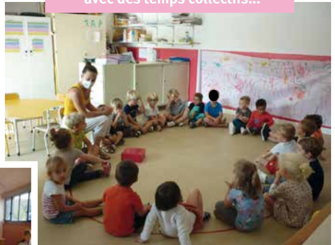
• La découverte de 2 mots chaque jour