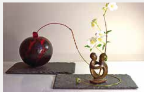
• Ikebana de l'espoir, juin 2020