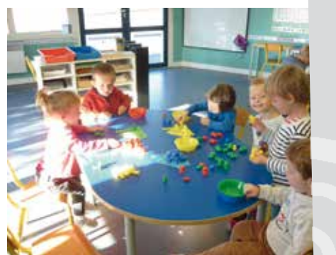
• Trier des couleurs