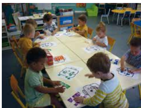
• Coller des gommettes