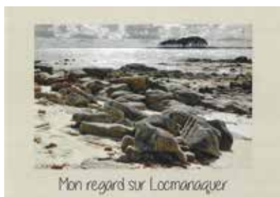
Le livret de l'exposition est en vente à la médiathèque (16€)