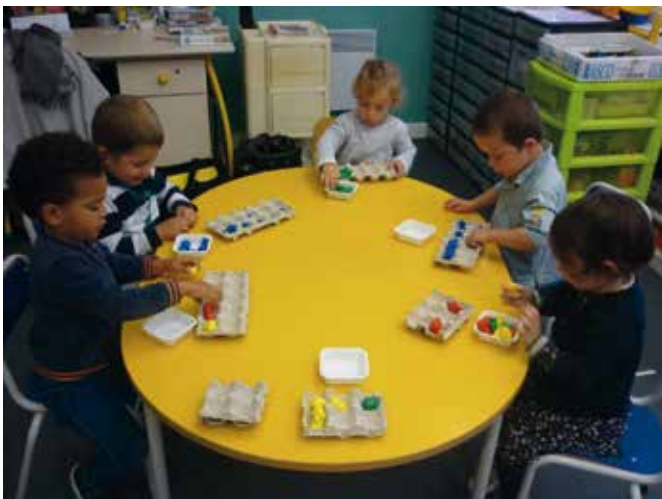
• Estimer des quantités