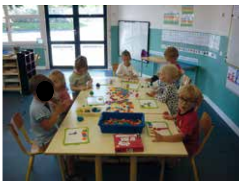
• Ecrire son prénom en pâte à modeler