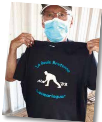
• Le vice président présente le tee shirt de l'ALBB

Toutes et tous ont une pensée pour les personnels de santé qui méritent un grand MERCI. Et BLOAVEZ MAT.