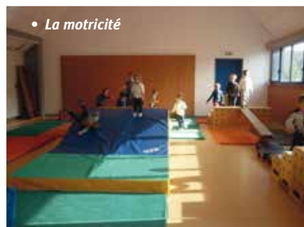
• La motricité