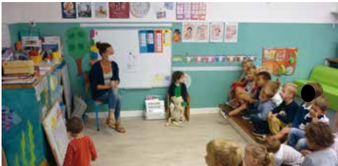
• La date, l'appel