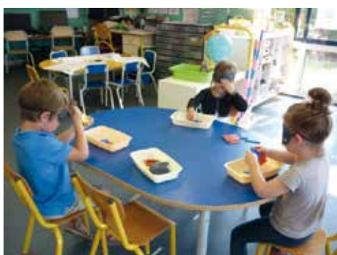
• Reconnaitre par le toucher